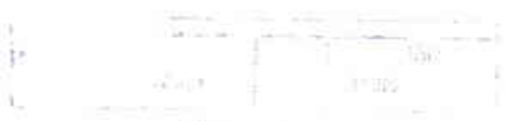
Diagram illustrating the structure of the document.